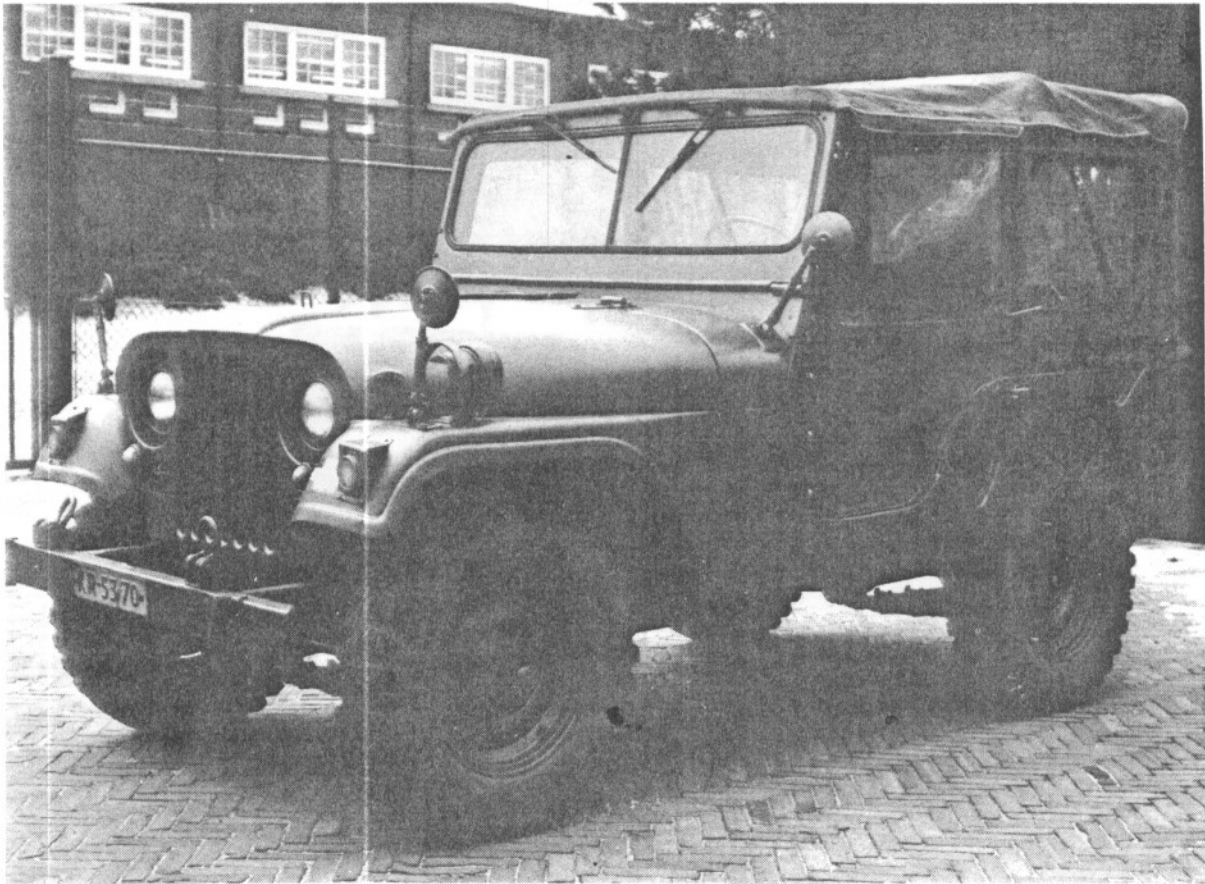
Afb. 4 Situatie overzicht: Vóór en rechter zij- aanzicht m/extra spiegels op voorschermen.